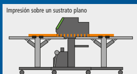
Impresión sobre un sustrato plano

Con la LEJ-640, puede imprimir prácticamente sobre cualquier sustrato, desde películas delgadas hasta cartulinas ligeras y cartones de hasta 13 mm de grosor, sin que se deforme el material ni el acabado de la superficie. Un mecanismo de sujeción del material garantiza una impresión de gran calidad, ya que sujeta los sustratos planos en su lugar y evita que se arruguen. Para una producción desatendida, la LEJ-640 incorpora un sistema de recogida que acepta una gran variedad de materiales en rollo.