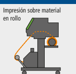
Impresión sobre material en rollo

*La compatibilidad de los materiales depende del peso y la superficie. Se recomienda realizar una prueba de impresión antes de la producción final.